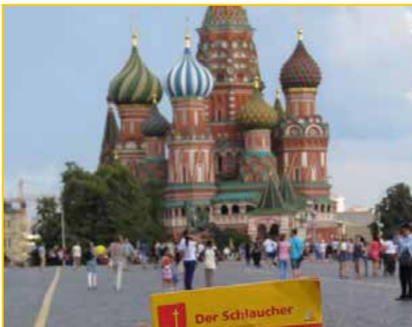
Der Schlaucher in Moskau