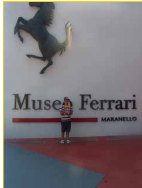
Der Schlaucher in Maranello