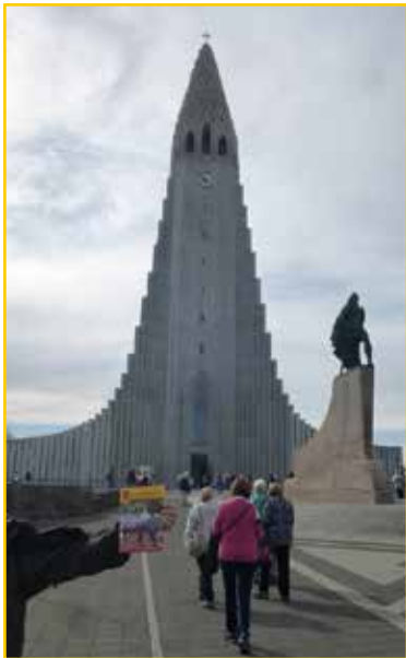
Der Schlaucher in Reykjavik