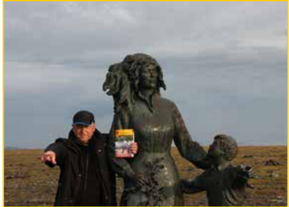
Der Schlaucher posiert am Nordkap