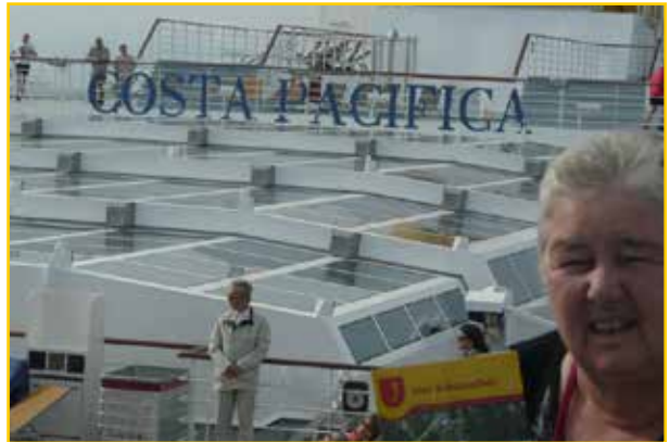
Der Schlaucher auf dem Weg von Kiel zum Nordkap