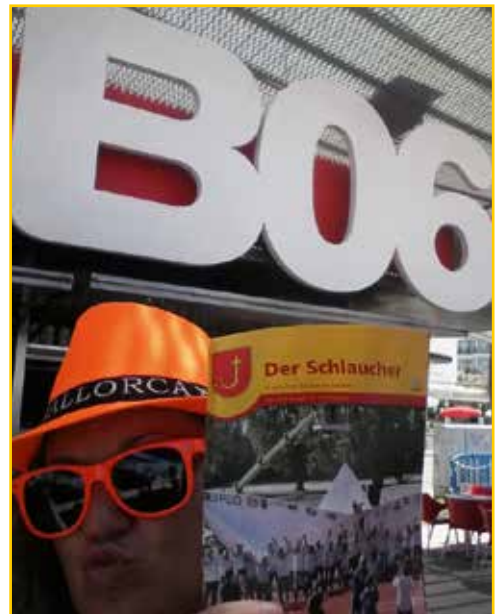
Der Schlaucher feiert am Ballermann