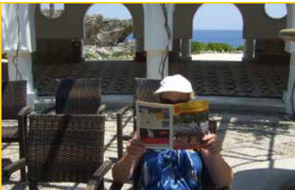
Der Schlaucher auf Rhodos, Kalithea Therme