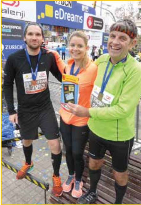
Der Schlaucher beim Halbmarathon in Barcelona

Das Ziel wäre, in einigen Jahren eine Ausstellung machen zu können mit dem Thema „Der Schlaucher bereist die Welt“. Ich freue mich auf Ihre Einsendungen und seien Sie kreativ.